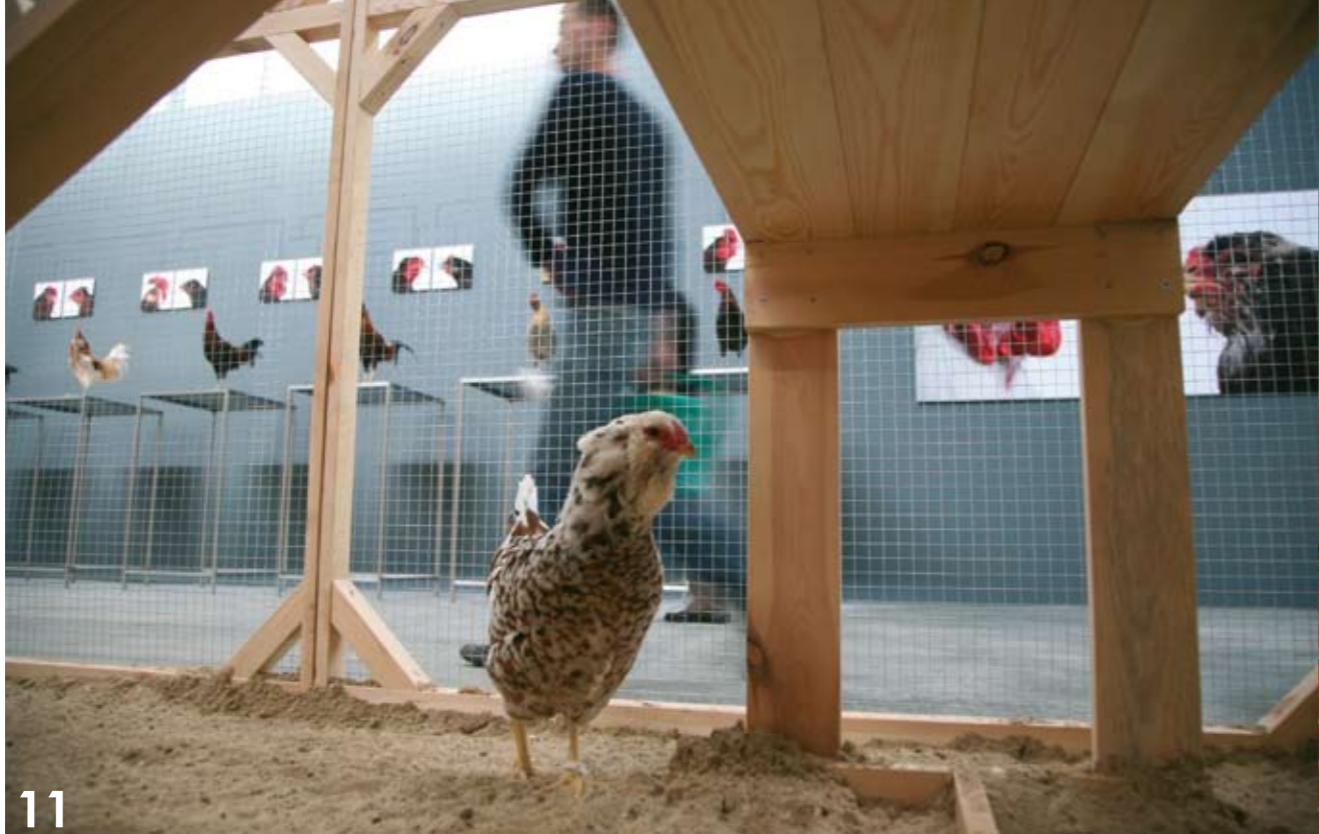
foto 11: 'The Cosmopolitan Chicken Project' - 'Against Exclusions' The 3rd moscow Biennale of Contemporary Art, Moscow (RUS), 2009