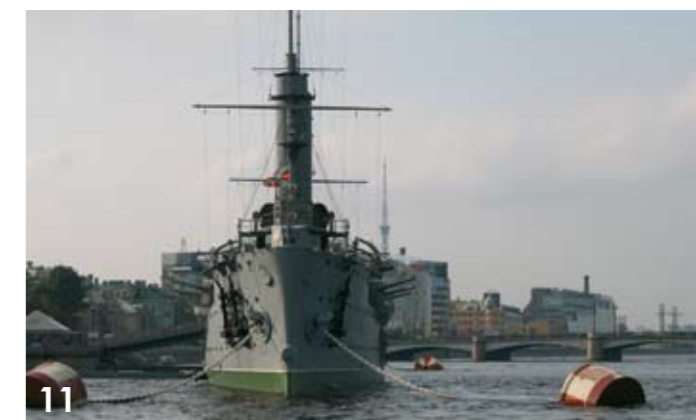
Foto 7: Detail uit de kerk van 'Het Verspilde Bloed' Foto 8: Poesjkin (schrijver) Foto 9: de kerk van 'Het Verspilde Bloed' Foto 10: Paleizencomplex van Peterhof Foto 11: De pantserkruiser Aurora